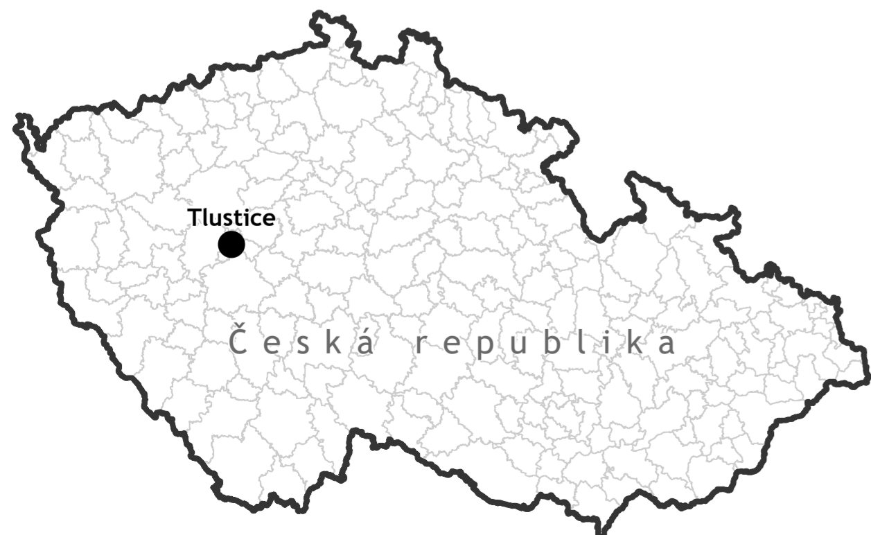
ŘEŠENÉ ÚZEMÍ V KONTEXTU STŘEDOČESKÉHO KRAJE